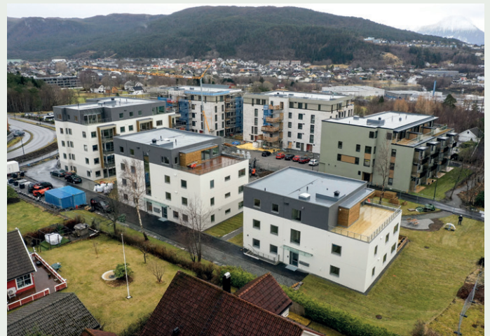
Veidekke-prosjektet Daaehagen sett i droneperspektiv fra nordvest med Daaetunet som bygges av Christie Opsahl bak.