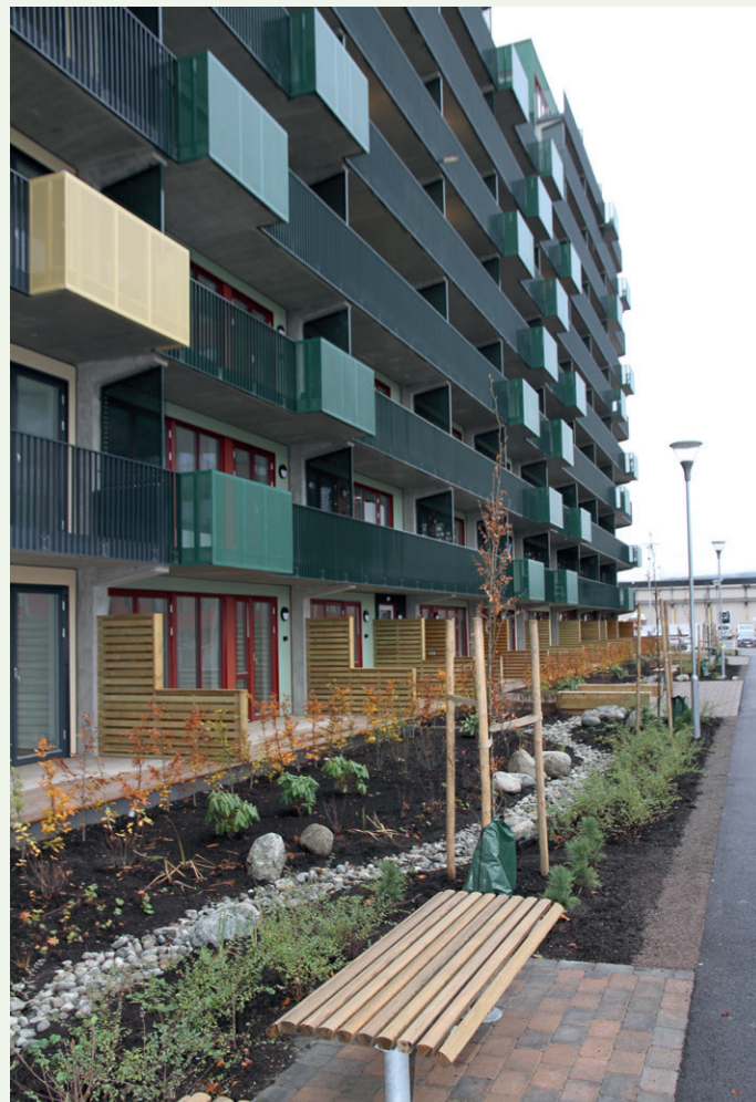
Balkongrekkverk med to forskjellige farger.