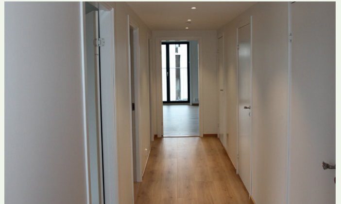
Denne leiligheten har en lang gang med inngang til soverommene og to bad/toalettrom.