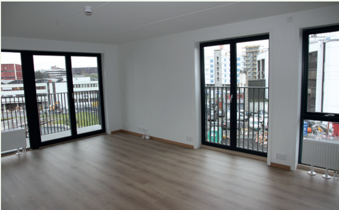
Fra stuen i en av de største leilighetene.