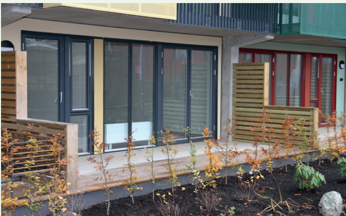
Leilighetene på bakkeplan har platting og liten hageflekk.