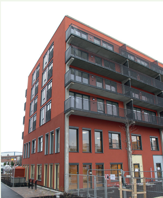
Den ene av de to boligblokkene har denne fargen og pussfasade.