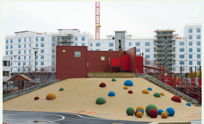
Prosjektet inneholder også en barnehage.