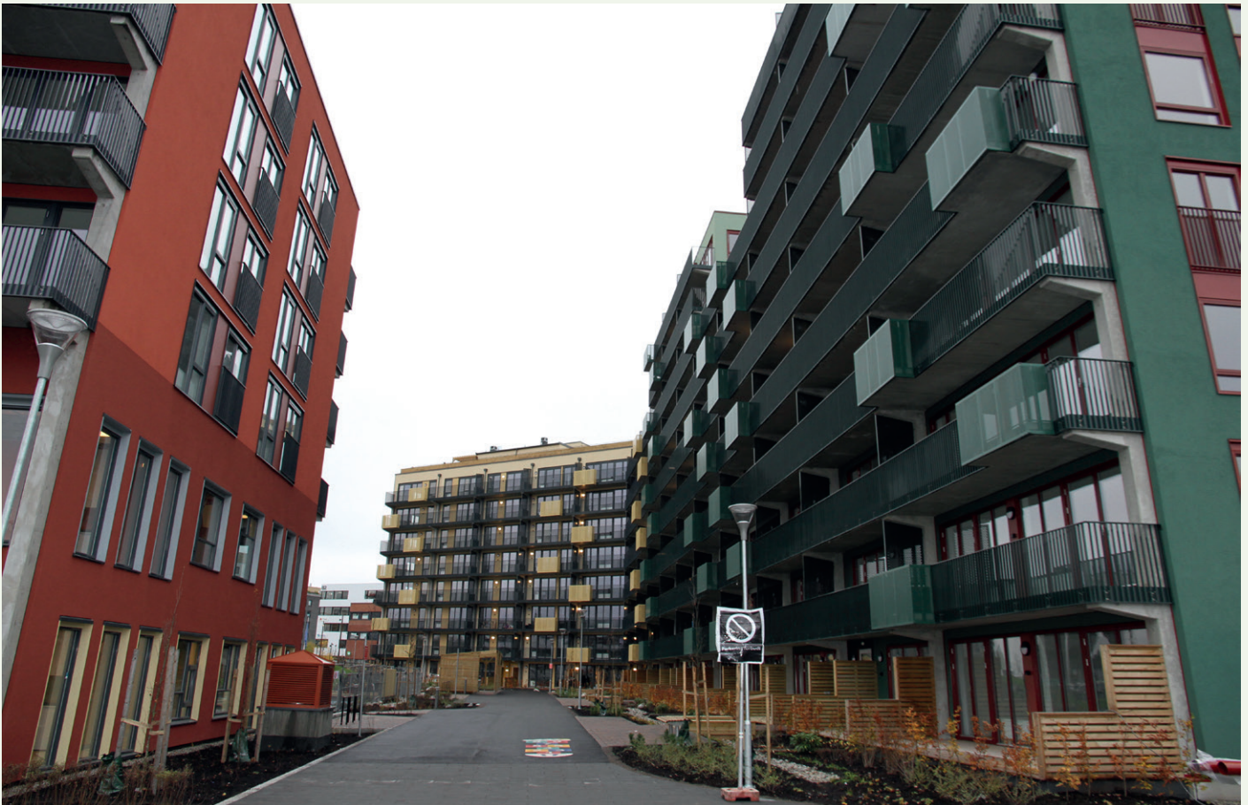
Forskjellige fasadeuttrykk og farger.