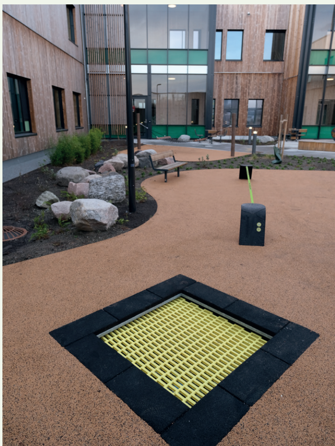
Utdørs er det alt fra sittegrupper til treningsfasiliteter.