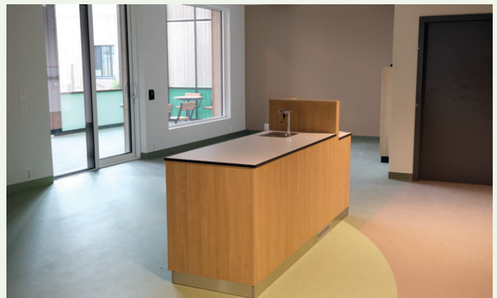
Byggene er ganske likt inndelt. Det er en seksjon i hver etasje med ansattrom og fellesområder, og tre seksjoner med pasientrom

Stålprofildører med glass og Stålplatedører til Psykiatribygget er levert av: