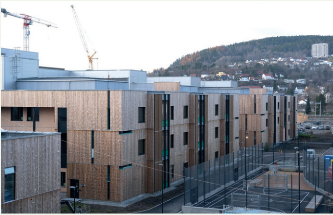
Byggene skal først tas i bruk når det nye sykehuset åpner dørene i august 2025.

og rømningstrappen, men ellers vinylgulv. Lokalene er imidlertid ikke møblert ennå. Det vil skje nærmere åpningen.