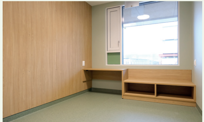
Byggene vil i alt romme 167 døgnplasser.