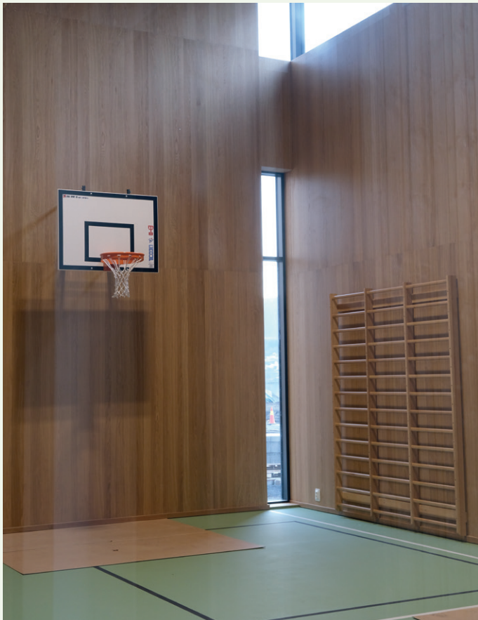
Det er bygd fellesarealer med både gymsal, stuer, oppholdsrom med TV og kjøkken.