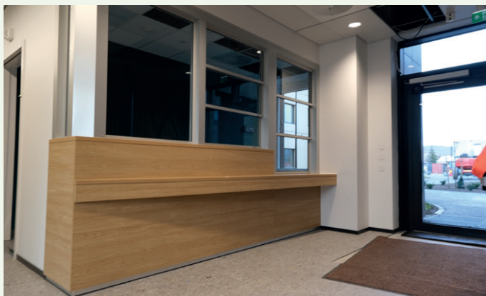
Psykatribyggene har egen resepsjon.