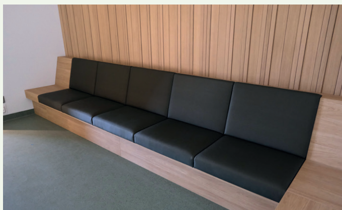
Møblene i bygget er i hovedsak fastmontert.