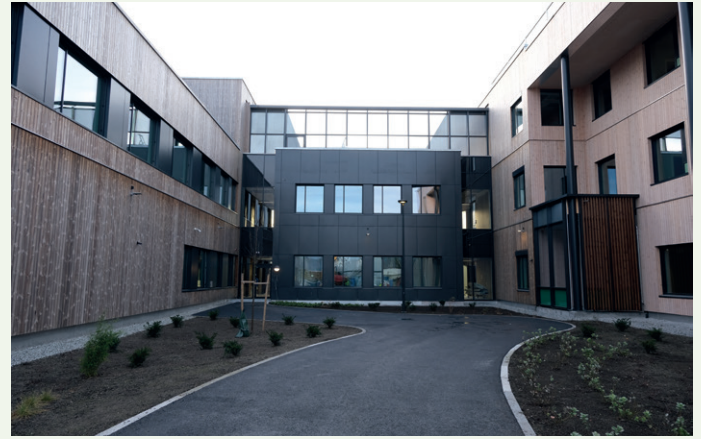
Byggene er koblet sammen av en korridor mellom hvert bygg

– Det er et stort prosjekt, og det er unike med byggene er fokuset på sikkerhet og robusthet. Lokalene skal tåle en støyt og er spesial-