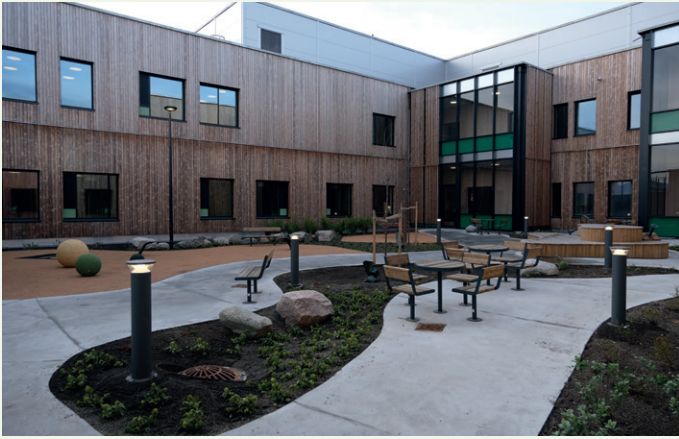
Byggene har et gårdsrom i midten.

Det minste bygget er for barn og ungdom, mens de to andre er for voksne pasienter. Byggene vil i alt romme 167 døgnplasser og 16 poliklinikkrom, samt kontorer, møterom og fellesarealer med både gymsal, oppholdsrom og kjøkken.