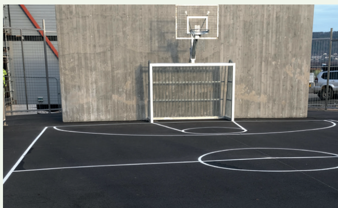
Det er også bygd ballbinger på uteområdet.