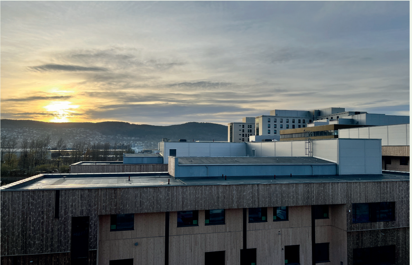
Psykatribyggene har et samlet bruttoareal på 18.500 kvadratmeter.

som vi kan ta med oss i tilsvarende prosjekter framover, sier han.