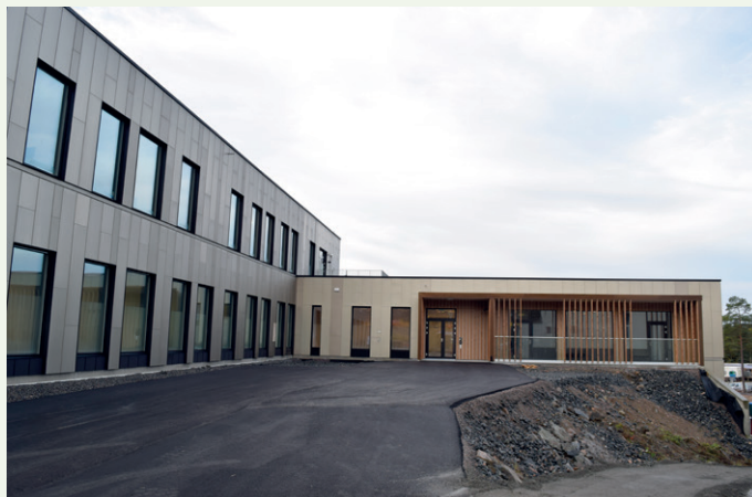
Fasaden på psykiatri- og habiliteringsbygget mot nordvest.

delen, men denne del av bygget har de samme spesialfunksjoner som et rørpostsystem som går rundt i hele bygningsmassen der det for eksempel kan sendes blodprøver fra en avdeling rett til laboratoriet, og et unikt søppelhåndteringssystem der søppel sendes gjennom systemet fra en avdeling og rett i containere på en søppelhåndteringssentral, forklarer prosjektdirektøren.