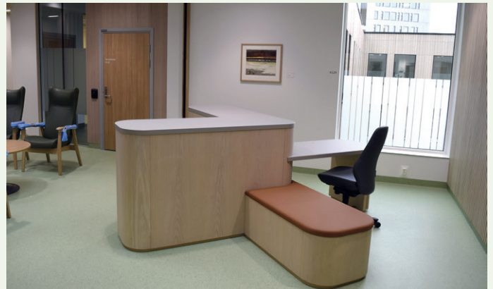
Tanken er at personalet skal sitte mest mulig ute der pasientene er og ikke inne på et vaktrom.

grad. Vi bestemte oss tidlig for å ha god kvalitet på rigg og bespising og har fått tilbakemeldinger på at dette har vært en attraktiv byggeplass å komme til med god mat og pleie.