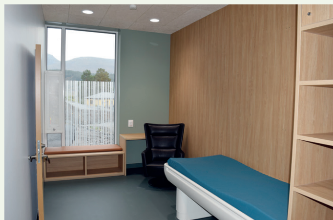
Pasientrom i psykiatribygget.

har hentet inspirasjon og erfaringer fra andre tilsvarende bygg landet rundt.