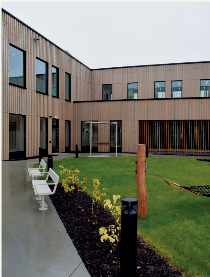
Atrium i psykiatriavdelingen.