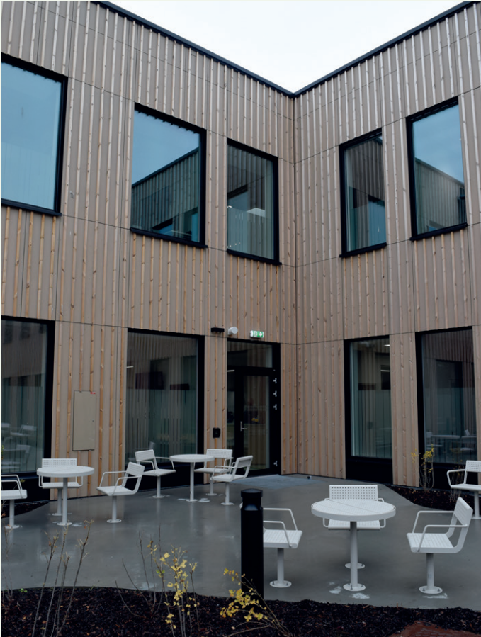
Sittekrok i et av atriumene.