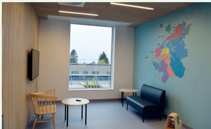
Venterom med utsikt i psykiatriavdelingen.

www.ovrebofargehandel.no / post@ovrebofargehandel.no