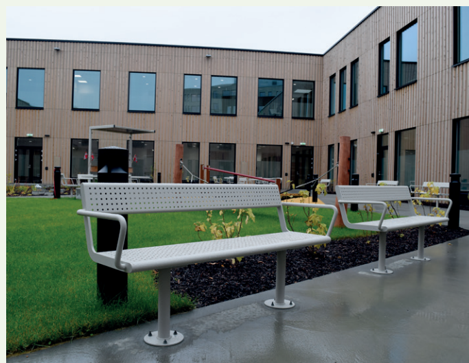
Benker og grøntareal for pasienter i atriumet.

sidestilte entrepriser. Dermed har vi redusert den økonomiske risikoen og gjort det mulig også for mindre selskap å være med, poengterer prosjektdirektør Heimdal.