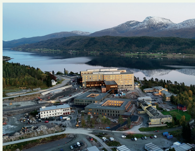
Det nye sykehuset sett fra nordvest med psykiatri- og habiliteringsdel nærmest.