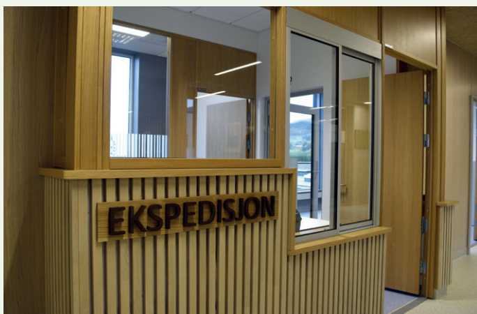
Ekspedisjon for psykiatri.