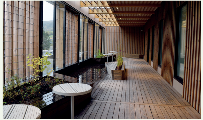
Delvis overbygd og innebygd veranda til bruk for psykiatrispasienter.