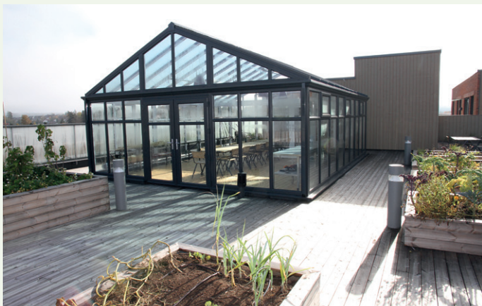
Boligkomplekset har både private og felles takterrasser, sistnevnte med lite tekjøkken.

nasjon av rød, sandgul og mørk tegl. For å skape ytterligere liv i fasadene er det innpasset felter med rullskift, utstikkende rader og kopper, skriver Landmark.