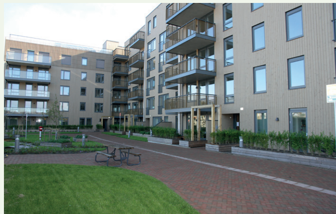
Inn mot gårdsrommet er det lys beige trepanel på fasaden.