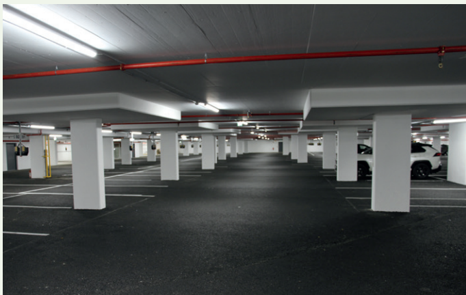
Gartneritaket har et stort parkeringsanlegg med garasje plasser.