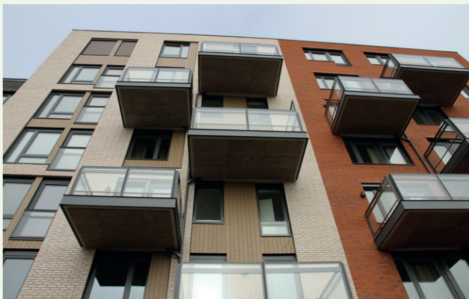
Utenpåhengte balkonger og ulike fasader på de tre byggene.