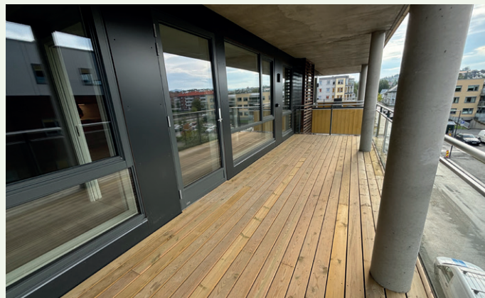
Det er lagt vekt på å lage romslige balkonger.