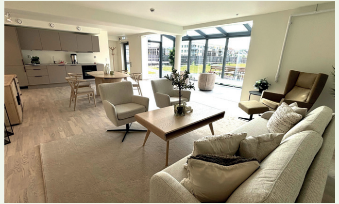
Hagestua er hjertet i Bryggehagen. Alle beboerne har nøkkel og kan møte hverandre når de vil.