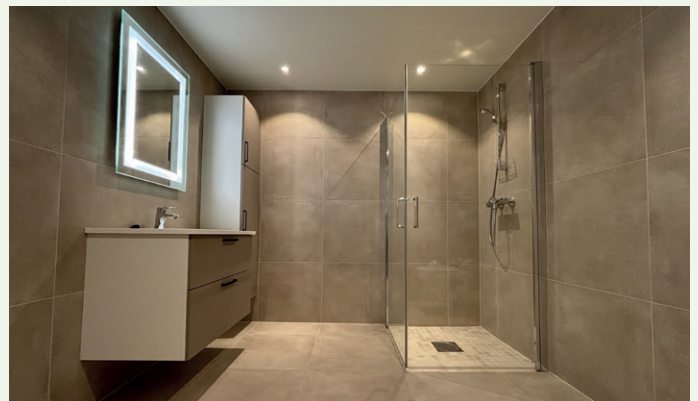
Badene er alle plassbygde.

Levanger Brygge Utbygging AS eies 50 prosent av Boligbyggelaget TOBB, med base i Trondheim, og Sebo Boliger AS. Sebo eies av lokale aktører på Levanger. Bryggehagen er den siste utbyggingen på indre havn i Levanger.