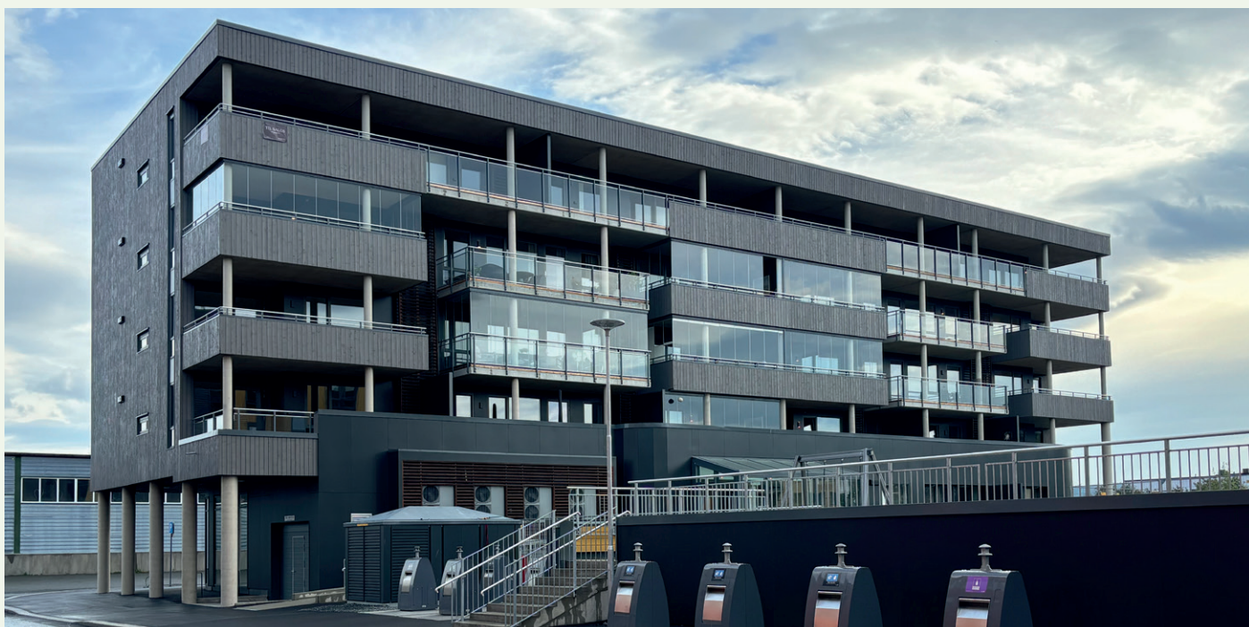
Bryggehagen (Hus 1) har store balkonger som vender mot sørøst. Ulike rekkverk på balkongene skaper variasjon.