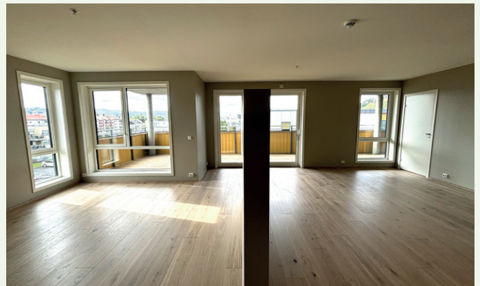
Stue og kjøkken i en av de store leilighetene.