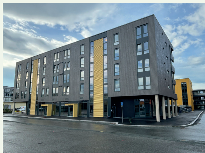
Første etasje mot Helga den fagres gate har næringslokaler.

sjø høyere enn gatene utenfor og har adkomst via ramper og trapper.