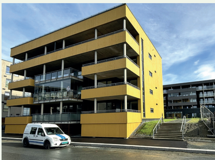
Hus 3 har balkonger ut mot Gunnlaug Ormstunges gate. Felleshagen er hevet over gateplanet og nås via trapper og ramper. Hus 1 i bakgrunnen.