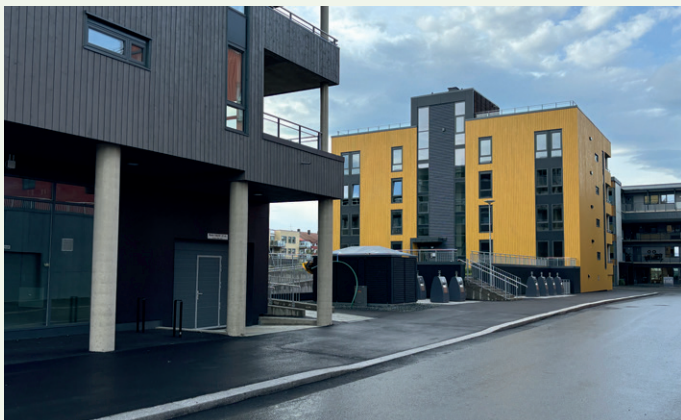
Hus 3 har 11 leiligheter som alle har utsyn til felleshagen som ligger mellom byggene i prosjektet.