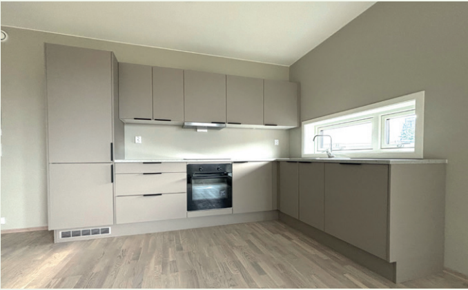
Alle kjøkken har samme design.